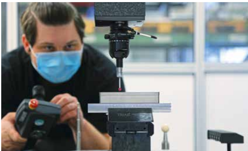
Die Erowa-Messmaschine ist in den Prozess integriert, misst die Teile nach dem Fertigen vollautomatisch, kann im Bedarfsfall aber auch manuell bedient werden.

wenige Werkzeugmaschinen-Hersteller in Frage kommen.»