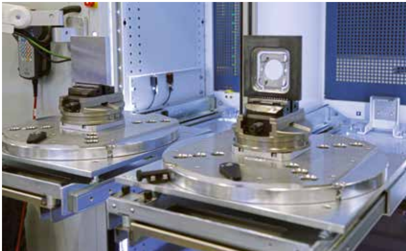
Hier die Ent- und Beladestation mit Rohteil (links) und Fertigteil. An insgesamt zwei Be- und Entladestationen kann die Anlage unabhängig voneinander bedient werden.